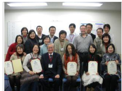
マンダラチャート認定講師第1期生

2泊3日のセミナーで「マンダラチャート」「マンダラ思考」「マンダラ手帳」を習得し、それを人に伝えられるようになります！