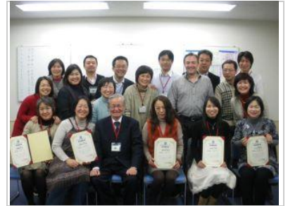
マンダラチャート認定講師第1期生

2泊3日のセミナーで「マンダラチャート」「マンダラ思考」「マンダラ手帳」「マンダラ人生計画」を習得し、それを人に伝えられるようになります！